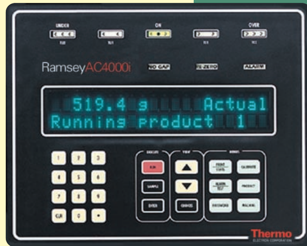
Ramsey AC4000i Controller