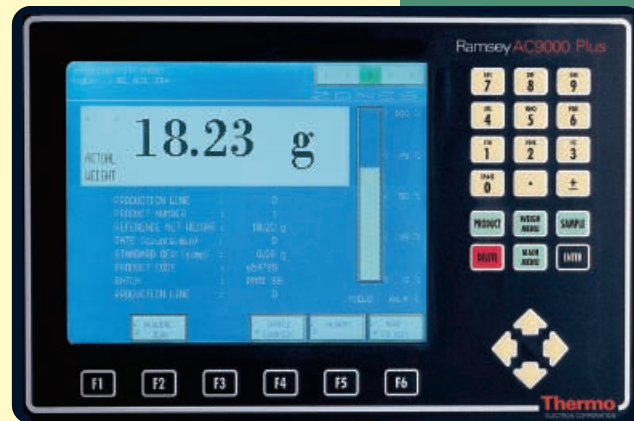
Ramsey AC9000-plus Controller

Enkele van de standaard kenmerken van de Ramsey AC4000i zijn o.a. de mogelijkheid om 15 verschillende producten in het geheugen op te slaan, het vermogen om elementaire statistische gegevens over de productie te verschaffen en een classificatie in drie/vijf gewichtscategorieën te maken. Het systeem kent vele opties om de capaciteit van de elektronica te verhogen zoals uitstoot verificatie, servoregeling en Ethernet communicatie. De veelvuldig toegepaste combinatie van de Ramsey AC4000i en de GP-serie controleweger geeft aan dat dit een perfecte oplossing is voor algemene weegtoepassingen.