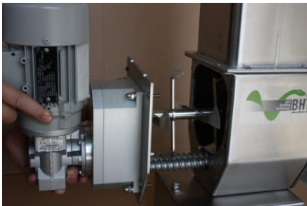
Eenvoudige en snelle demontage en reiniging